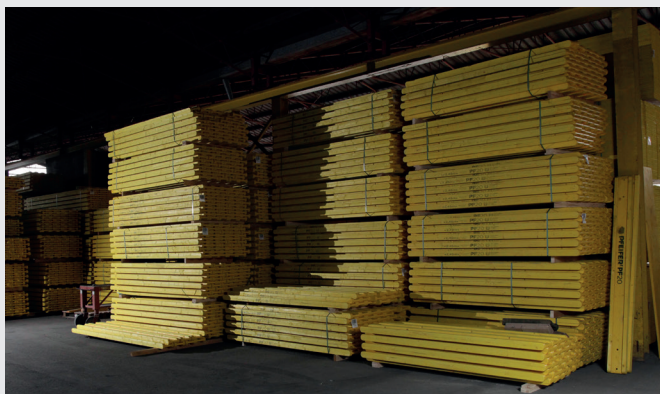
Délais de livraison courts grâce à la tenue en stock dans nos succursales.